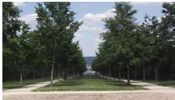
11. Réouverture des vues dans le cadre du réaménagement du parc de Brabois.

Articles du code forestier sur les forêts de protection