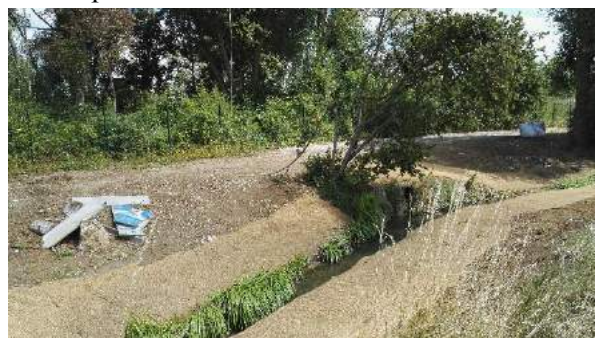
5. Reprofilage des berges.

3) Des actions favorisant la présence de la nature en ville :