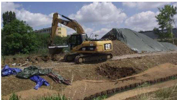
7. Chantier en cours lors de la visite.

Concernant la gestion des pollutions sur le chantier, l'entreprise retenue est une spécialiste du génie écologique. Les engins ont interdiction de traverser le ruisseau et des barrages filtrants ont été mis en place. Une tache de renouée a été identifiée et exportée en décharge spécialisée. Le reste des déblais/remblais est géré au niveau du projet ou à défaut sur l'agglomération.