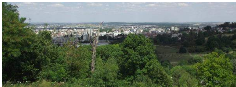
1. Vue générale de l'agglomération.

Le service espaces verts est dans un autre pôle (Services et infrastructures) : c'est le service opérationnel de la Métropole. Il compte 85 agents, majoritairement en encadrement ou pour des opérations d'entretien très spécifiques. La superficie totale en gestion est de 750 ha : elle a beaucoup augmenté avec les rétrocessions des espaces publics suite aux opérations d'aménagement, et des accords avec les communes de la métropole pour certains espaces d'intérêt communautaire. La gestion est donc externalisée à 80%, pour des raisons de logistique principalement, via des marchés d'entretien à bon de commande de 4 ans, renouvelables trois fois.