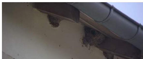
10. Nids d'hirondelles au centre équestre (abords du parc de Brabois).

Suite à la destruction d'une vingtaine de nids d'hirondelles par un particulier (sur sa maison) dénoncé par la LPO, la Métropole est intervenue pour le remplacement de chaque nid détruit (aux frais du particulier – au lieu de payer l'amende). Elle a fourni gracieusement à la LPO la nacelle nécessaire à l'accès à la toiture.