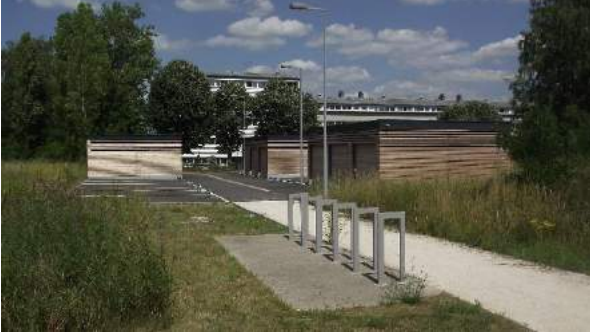
4. Poche de stationnement mutualisé en bordure du quartier.

poches de stationnement mutualisés a été privilégié.