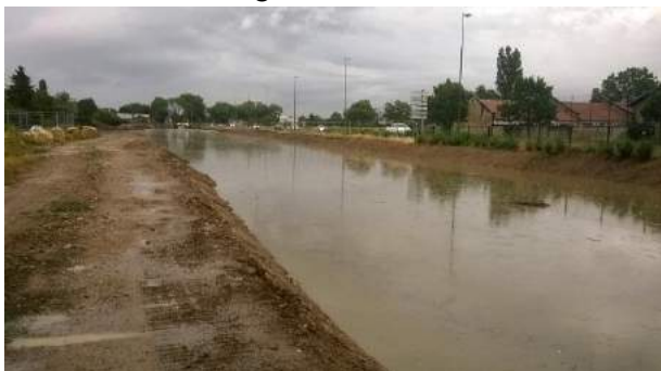
6. Le Grémillon suite à une pluie d'orage en juillet 2017 (proche d'une décennale).

Les travaux de renaturation sur l'ensemble du Grémillon ont un réel potentiel en termes