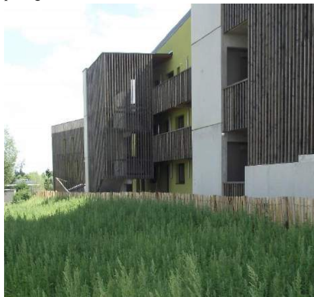
2. Vue de lots déjà construits à Biancamaria.

- « s'infiltré » vers les parcelles privées pour conforter la logique de plus-value paysagère au quartier. L'enjeu est de créer les conditions d'un parc habité (par le plus grand nombre) en "additionnant" les valeurs du parc infiltré, des jardins privés et partagés.