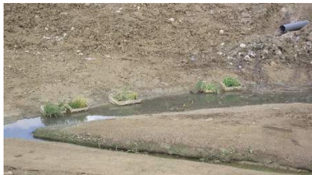
8. Reméandrage et végétaux à planter. / Micand A., Plante & Cité

La palette végétale est constituée d'espèces / essences indigènes pour la reconstitution de la ripisylve, non issues de prélèvement dans le milieu naturel du fait des quantités nécessaires au projet.