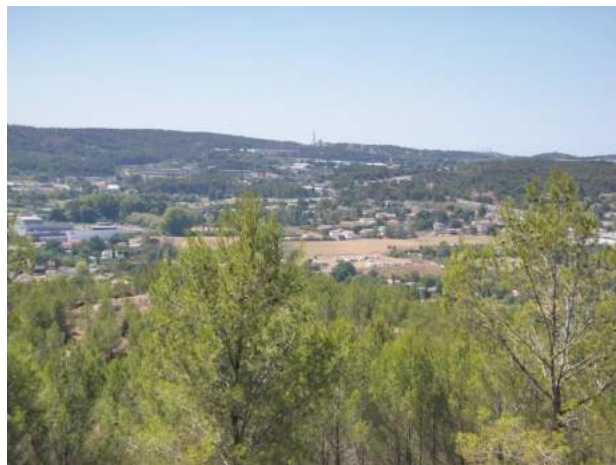
Fig. 3 / Vue sur les terres agricoles préservées au sein du PLU

Consulter le projet de révision du PLU de Bouc-Bel-Air