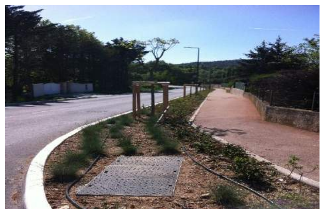
Fig. 4 / Rue Saint-Hilaire.

Ainsi la base communale de la biodiversité, qui a servi de base à la réflexion de la révision générale du PLU, sera le "point zéro" de cette évaluation qui sera menée dans trois ans. L'actualisation des inventaires en lien avec la carte de synthèse des enjeux de la biodiversité sur la commune de Bouc Bel Air sera un moyen objectif pour évaluer le développement de la biodiversité sur le territoire. »