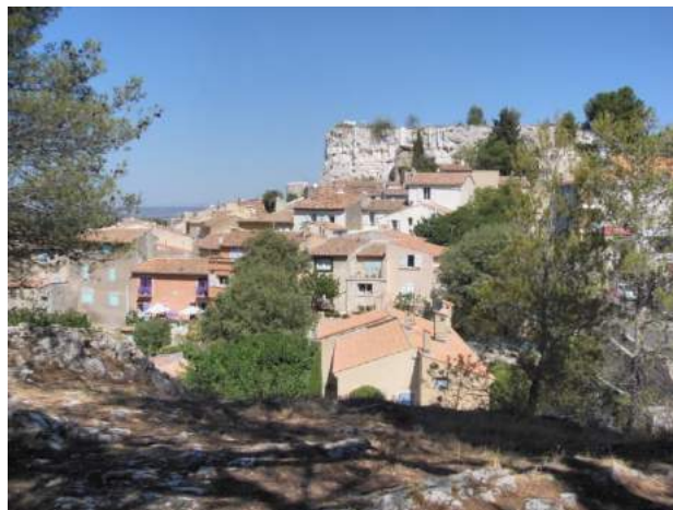
Fig. 1 / Vue du centre-ville de Bouc-Bel-Air en haut de la colline

A la réduction conséquente des espaces constructibles de la Commune s'ajoute également l'identification au sein du PLU de l'ensemble des espaces d'intérêts écologiques, patrimoniaux et paysagers à préserver