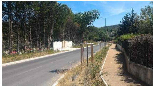
Fig. 5 / Vue de la rue Saint-Hilaire

Une piste d'amélioration consisterait à travailler sur la trame noire en régulant l'éclairage public refait à l'occasion de la réfection des voiries.