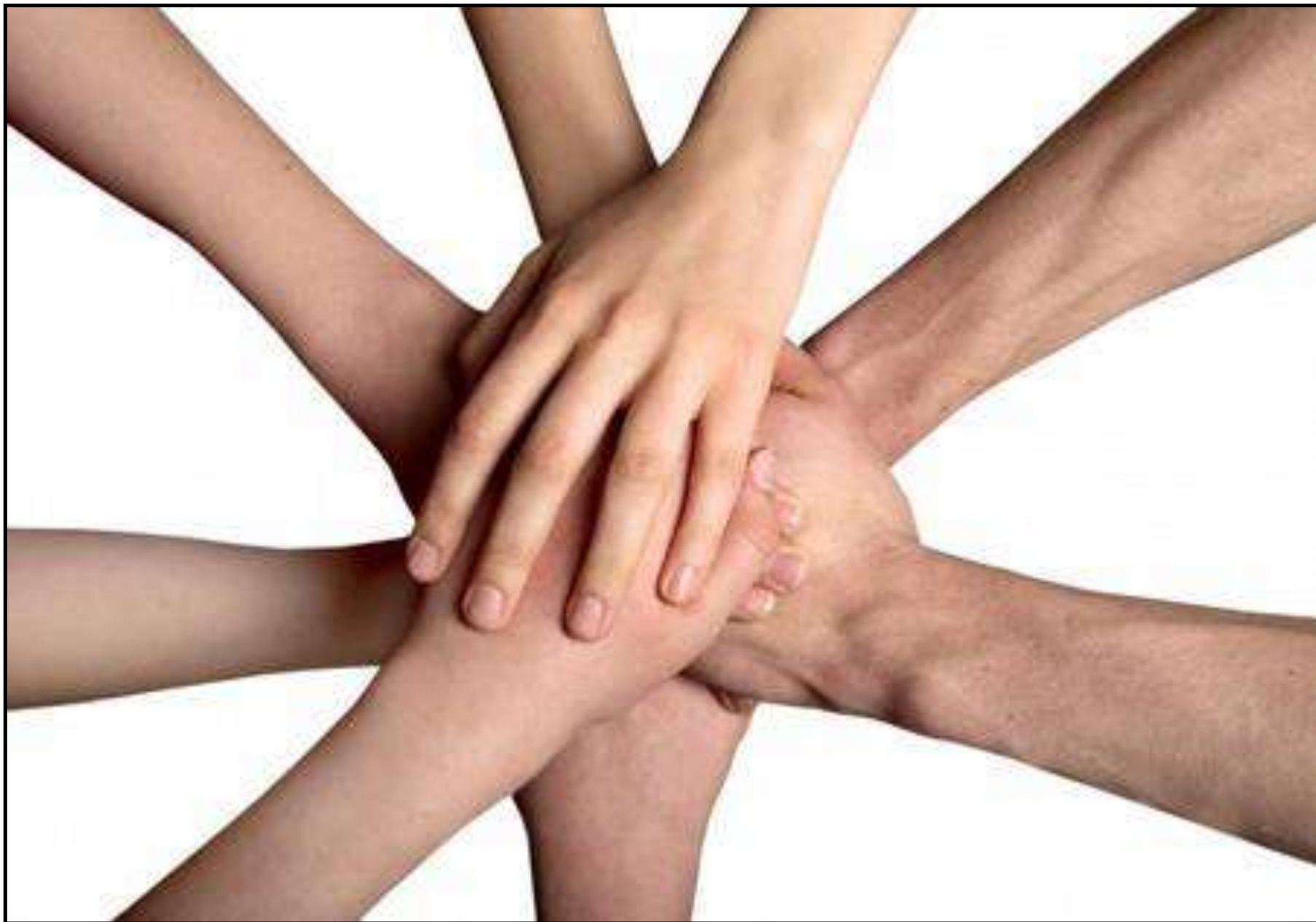
Atelier Capitale de la Biodiversité Le 04 avril 2019 – Besançon