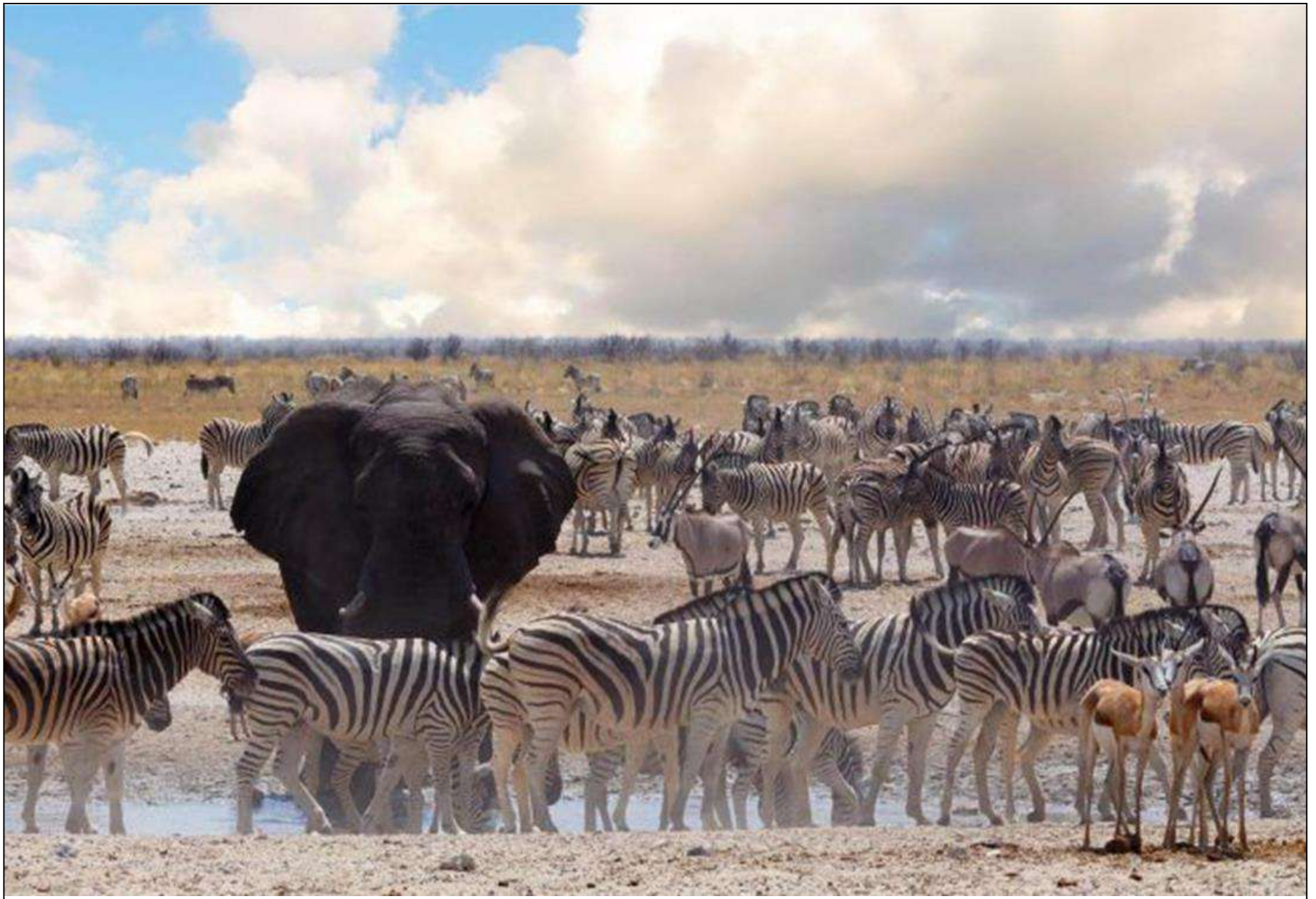
Atelier Capitale de la Biodiversité Le 04 avril 2019 – Besançon