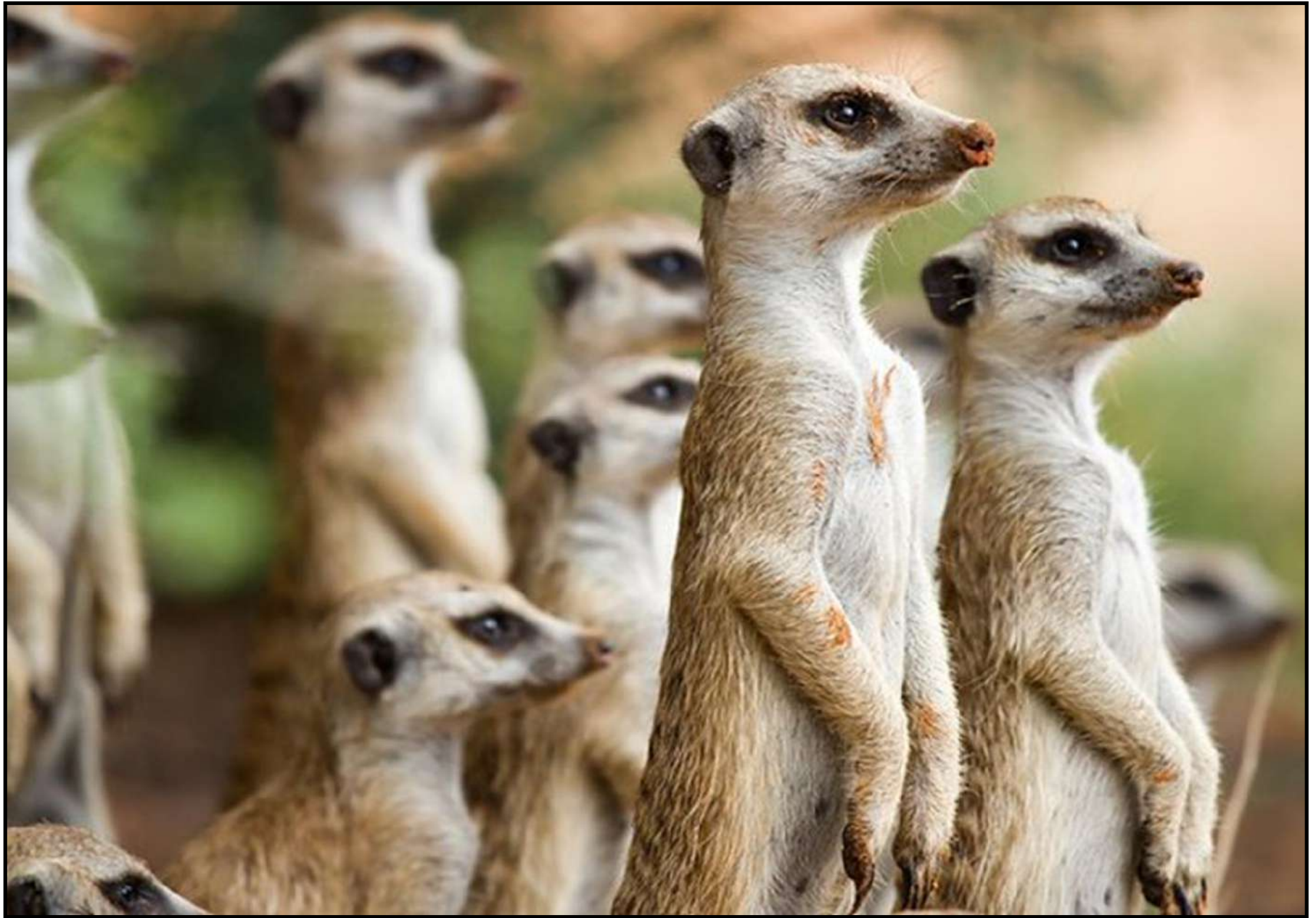
Atelier Capitale de la Biodiversité Le 04 avril 2019 – Besançon