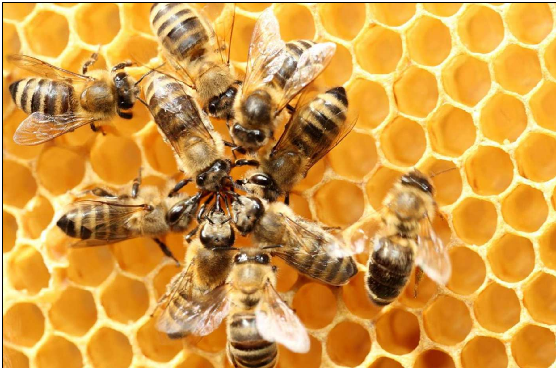
Atelier Capitale de la Biodiversité Le 04 avril 2019 – Besançon