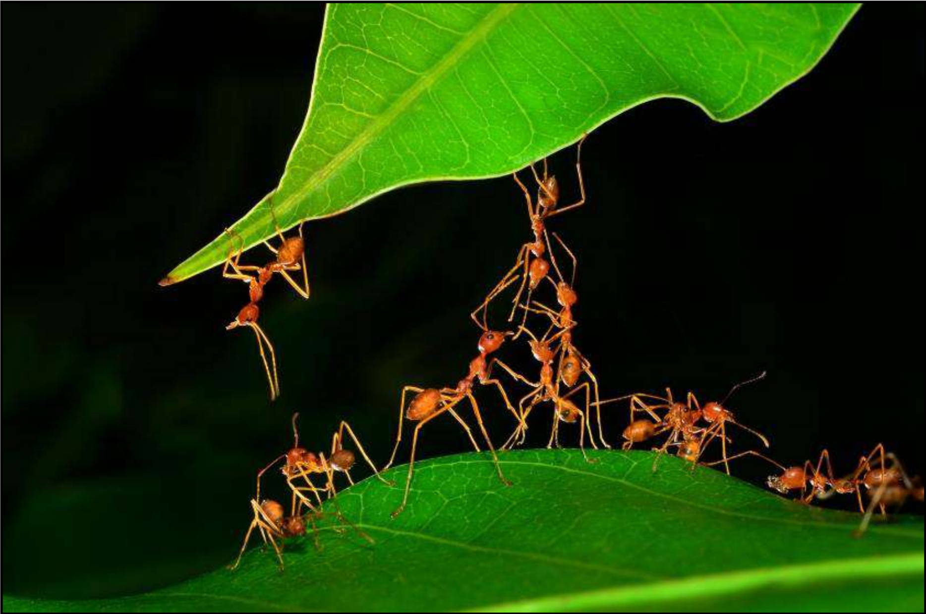
Atelier Capitale de la Biodiversité Le 04 avril 2019 – Besançon